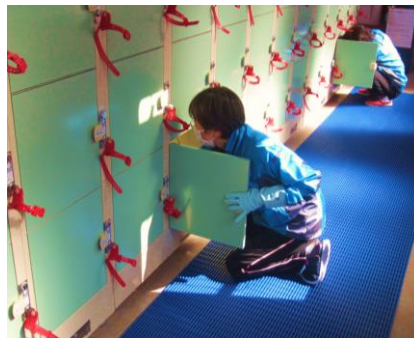
ロッカー内消毒・除菌