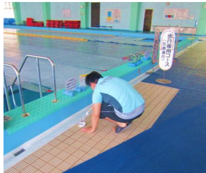
排水溝汚れ落とし