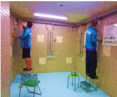
シャワー室配管サビ除去