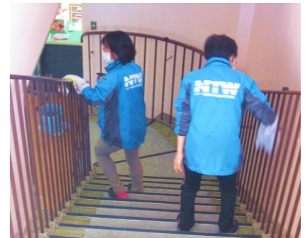
階段や手すり消毒・除菌

皆様が安全にご利用できますように… 開館するその日まで、中央市民プールでは皆様をお迎えする準備をしています。 スタッフが力合わせてピカピカにしましたので、楽しみにしてくださいね(^_^)